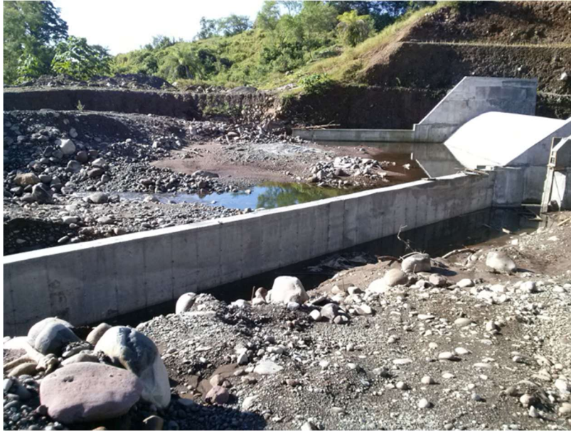
Presa de derivación