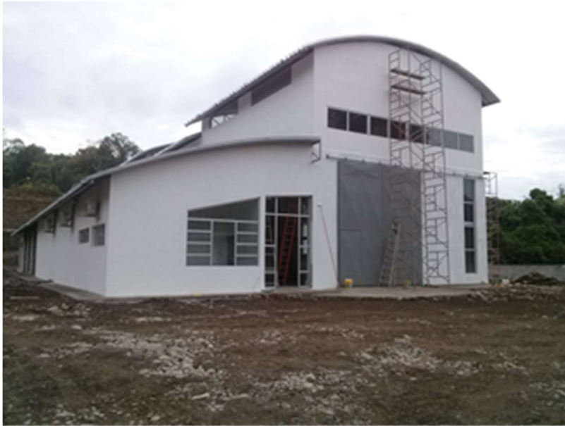
Vista exterior de casa de máquinas