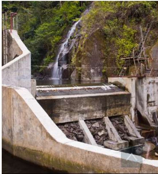
Presa de derivación