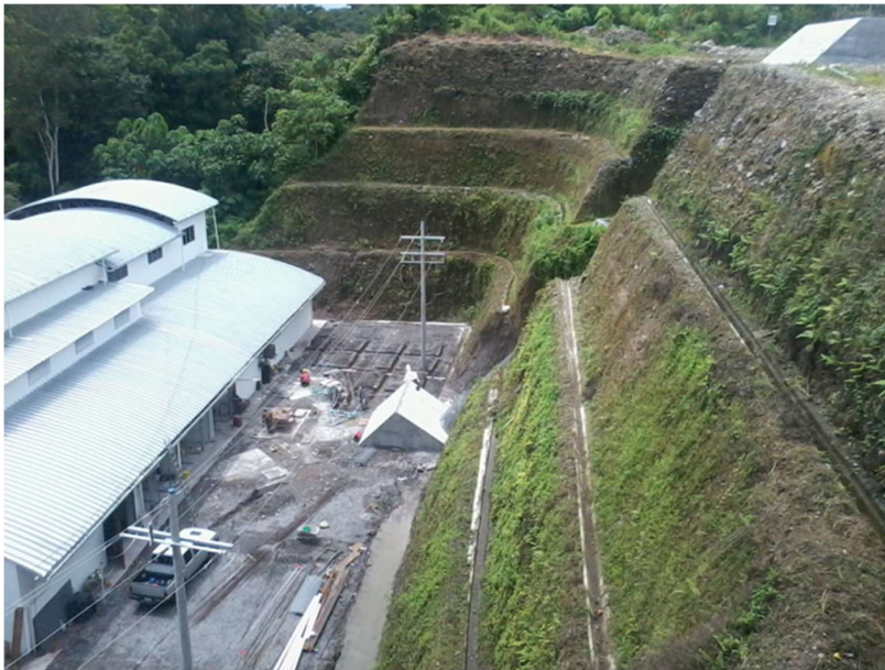
Vista externa de casa de máquinas