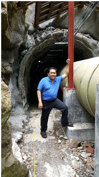
Tubería de baja presión dentro del túnel