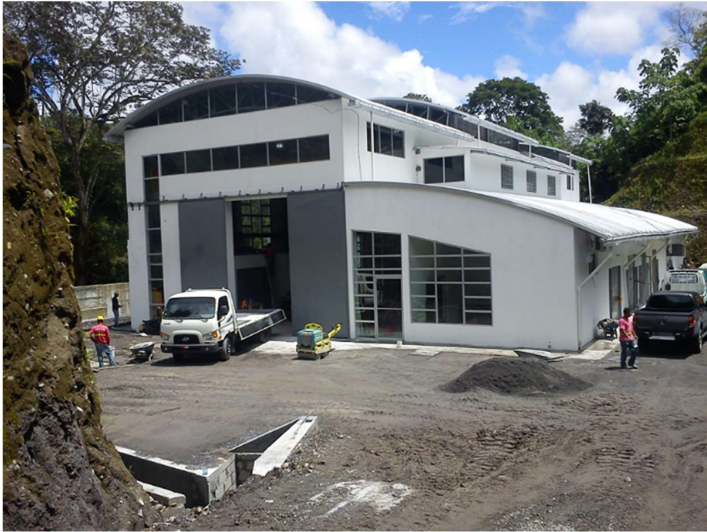
Vista externa de casa de máquinas