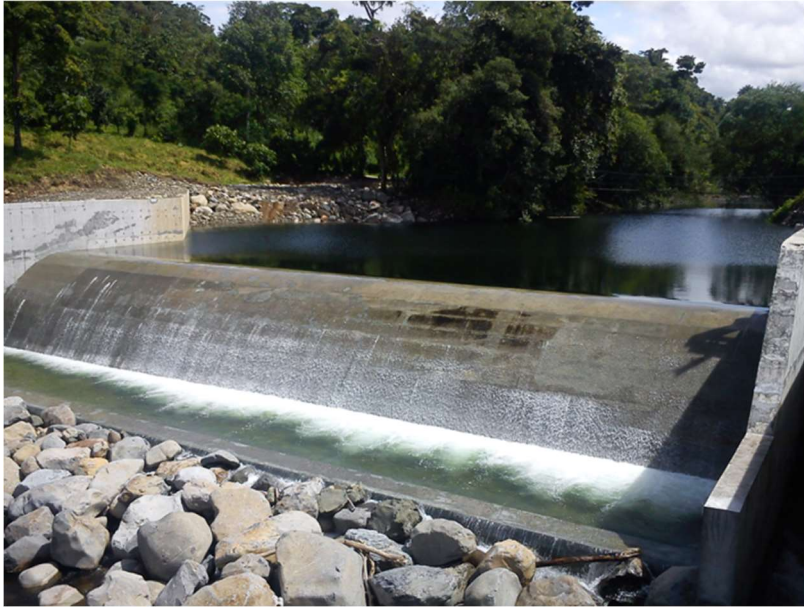
Presa de derivación