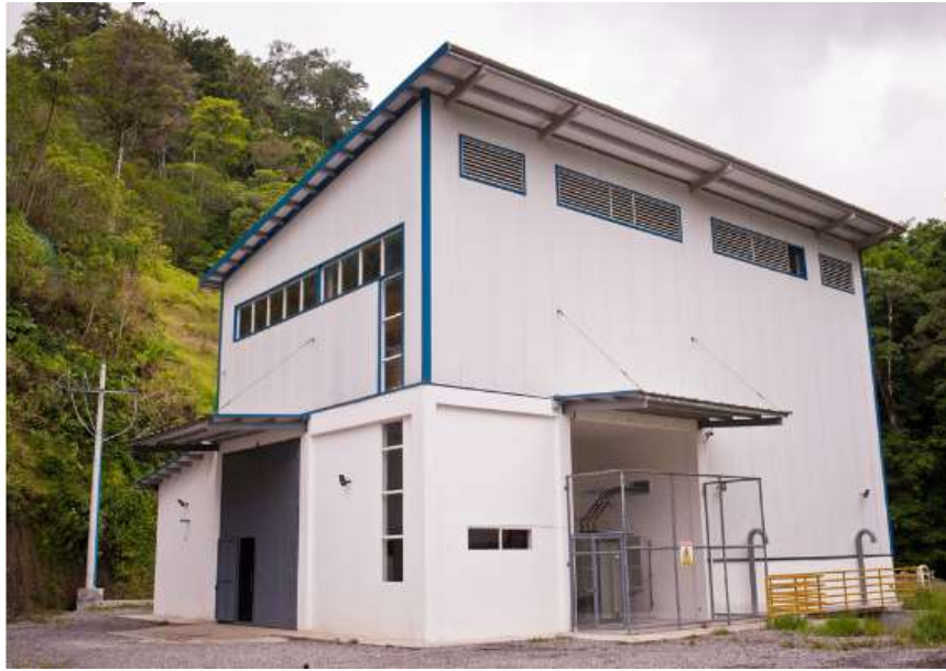
Vista exterior de casa de máquinas