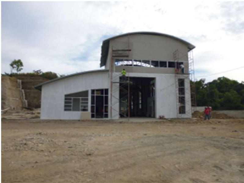
Vista exterior de casa de máquinas