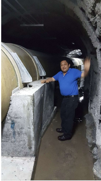
Tubería de baja presión dentro del túnel