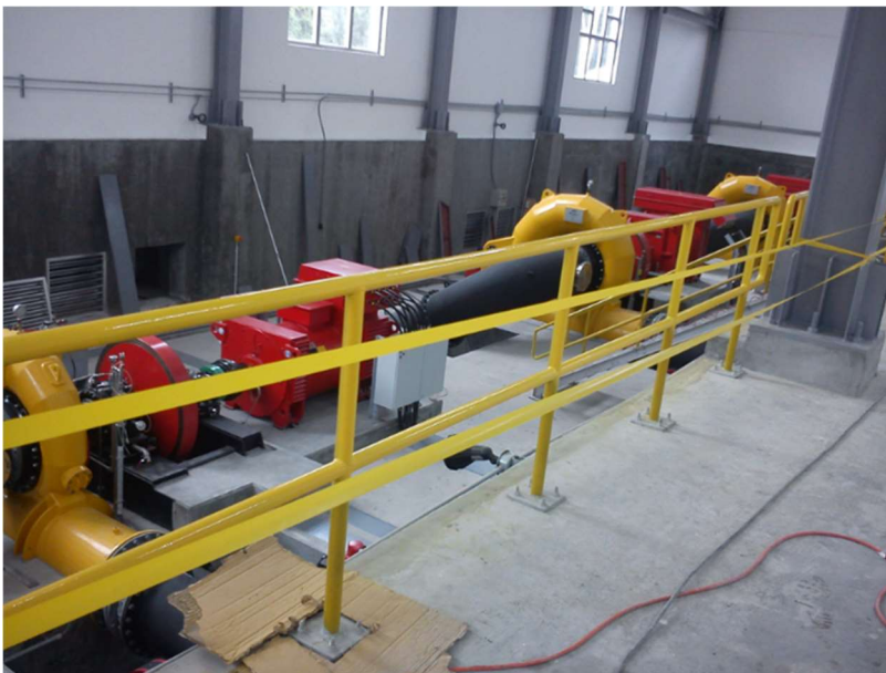
Turbinas Francis de eje horizontal