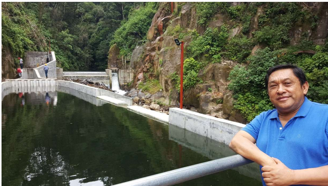
Tanque de presión