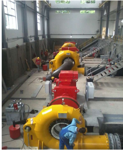
Turbinas Francis de eje horizontal